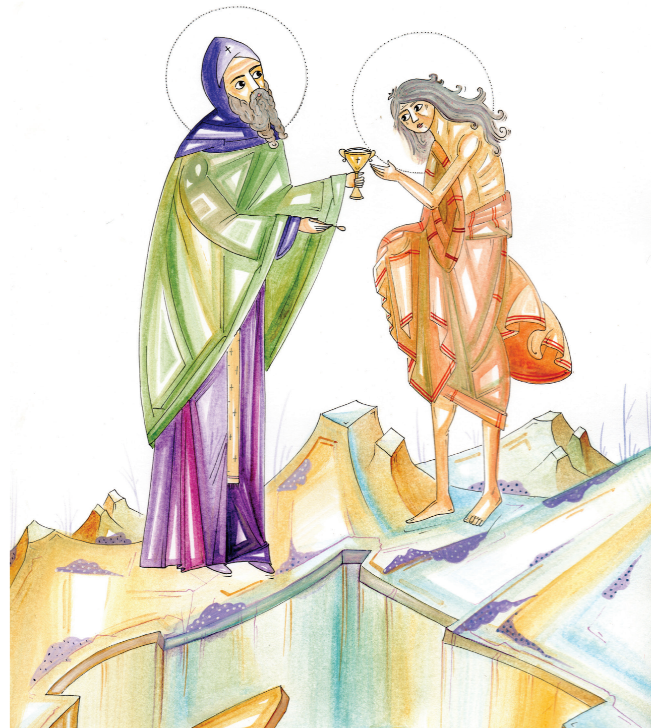
Илустрација: Сара Илџ

ПЕТА НЕДЕЉА ВЕЛИКОГ ПОСТА- СВЕТЕ МАРИЈЕ ЕГИПЋАНКЕ